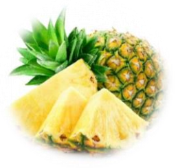
パイナップルエキス