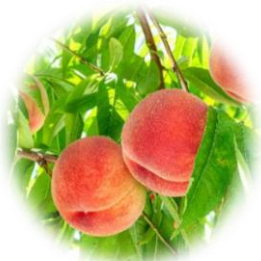
ピーチリーフエキス