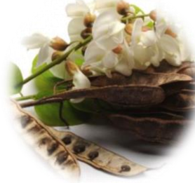
アカシアマクロスタチアエキス